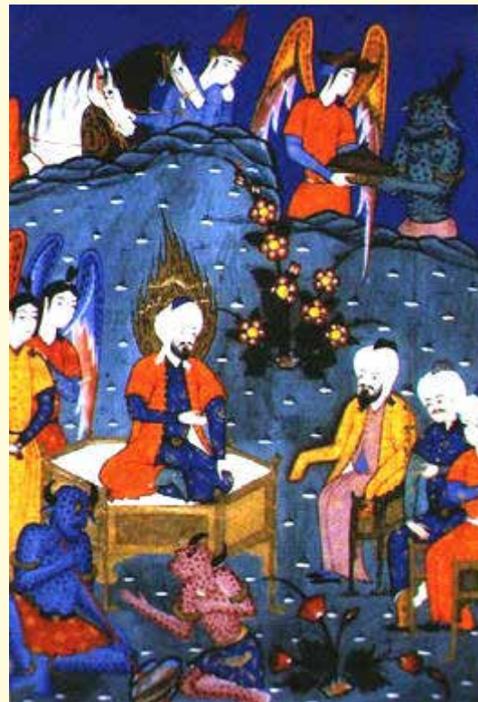
Salomo möchte die Königin von Saba zum Islam bringen - mit Hilfe von Dschinnen.

davon aus, dass diese, ähnlich wie die Menschen, in Stämmen, Sippen und Familien leben und hierarchisch strukturiert sind. Sie heiraten und pflanzen sich fort – allerdings, wie die Vögel, über das Legen von Eiern. Wie die Menschen haben sie einen Glauben, sind Juden oder Christen oder Muslime und teilen sich innerhalb der verschiedenen Religionen, wie die Menschen, in unterschiedliche Sekten und Glaubensschulen. Als gläubige Muslime vollziehen sie auch die Pilgerfahrt nach Mekka [2] . Es gibt unter ihnen aber auch Ungläubige, Ketzer und Heuchler.