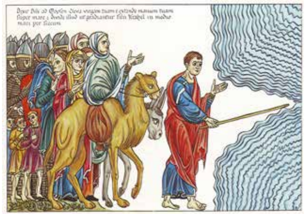
Moses spaltet das Meer

Patriziat der Städte lebte. Neben diesen abhängigen Bauern gab es auch die freien Bauern an den schwer zugänglichen Berghängen. Zeitgleich gab es zudem die Handwerker und Kaufleute. Weber geht davon aus, dass zwischen dem Patriziat der Städte und den bergsässigen Bauern und halbnomadischen Hirten eine feindschaftliche Stimmung herrschte. Neben der Beherrschung der Straßen erstrebten die freien Bauern und Hirten der Berge die Sicherung ihrer Fron- und Abgabefreiheit gegenüber dem Stadtpatriziat, und suchten womöglich ihrerseits die Städte zu nehmen, teils um sie zu zerstören, teils um sich selbst als Herrschaft darin festzusetzen. Mit geringer Ungenauigkeit kann man sagen: es kämpfte dabei das Bergvolk gegen die Ebene.