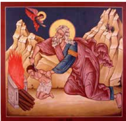
Christliche Darstellung der Opferung Isaaks

„101 Und wir verkündeten ihm einen braven Jungen. 102 Als er nun so weit (herangewachsen) war, dass er mit ihm (d.h. mit seinem Vater Abraham) den Lauf machen konnte, sagte Abraham: „Mein Sohn! Ich sah im Traum, dass ich dich schlachten werde. Überleg jetzt (und sag), was du (dazu) meinst!“ Er sagte: „Vater! Tu, was dir befohlen wird! Du wirst, so Gott will, finden, dass ich (einer) von denen bin, die (viel) aushalten können.“ * 103 Als nun die beiden sich (in Gottes Willen) ergeben hatten und er ihn (d.h. Abraham seinen Sohn) auf die Stirn niedergeworfen hatte (um ihn zu schlachten), 104 riefen wir ihn an: „Abraham! 105 Du hast den Traum wahr gemacht.“ So vergelten wir denen, die fromm sind. 106 Das ist die offensichtliche Prüfung. 107 Und wir lösten ihn mit einem gewaltigen Schlachtopfer aus. (Sure 37, 112-107)