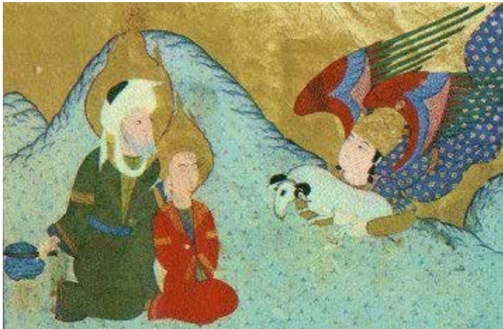
Islamische Darstellung der Opferung Ismaels

rung seines Sohnes dokumentiert werden. Während allerdings in der biblischen Tradition Isaak das zu opfernde Kind ist, ist es im Islam der erstgeborene Ismael.