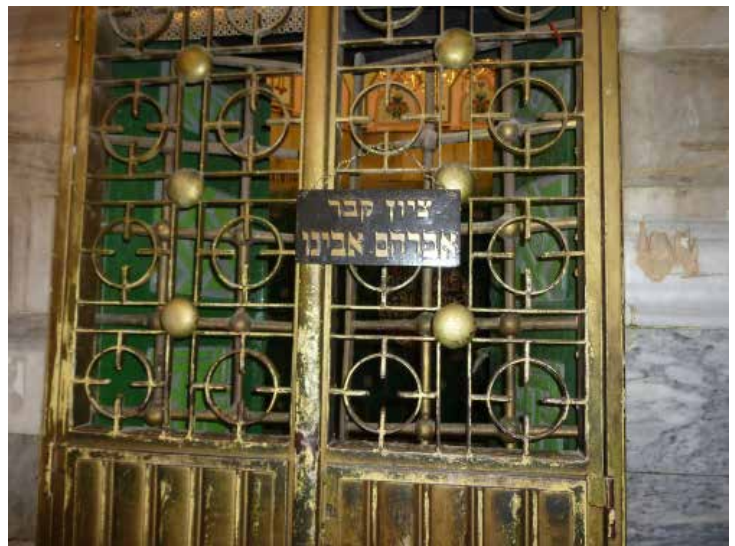
Grab Abrahams in Hebron

„Die Chronisten und Biographen sagen: Als Gott die Seele Abrahams zu sich nehmen wollte, schickte er den Todesengel in der Gestalt eines sehr alten Mannes zu ihm.(...) Abraham war freigebig im Bewirten. Er speiste und bewirtete Leute, und als er dies tat, war da plötzlich ein alter Mann, der auf der Straße vorbeiging. Abraham schickte ihm einen Esel, der Mann stieg auf, und als er zu Abraham kam, brachte dieser ihm Speise. Der Mann schickte sich an, einen Bissen zu nehmen und wollte ihn in den Mund stecken, steckte ihn aber einmal ins Auge, dann ins Ohr. Als er ihn dann in den Mund gesteckt hatte, wanderte er zum Magen und kam hinten wieder heraus. Abraham aber hatte seinen Herrn [Gott] gebeten, seine Seele nicht eher zu sich zu nehmen, als bis er ihn darum bäte. Er fragte den Greis, als er dessen Zustand sah: „Wie kommt es, Alter, dass du das machst?“ Er sagte: „Weil ich alt bin, Abraham.“ Abraham fragte ihn: „Wie alt bist du?“ Er nannte ihm sein Alter. Da rechnete Abraham nach und fand, dass der Mann zwei Jahre älter war als er. Er sagte zu ihm: Zwischen mir und dir sind nur zwei Jahre. Wenn ich so alt bin wie du, werde ich wie du.“ Der alte Mann sagte: „So ist es.“ Abraham aber sagte: „Gott! Nimm mich vorher zu dir!“ Da stand der alte Mann auf und ergriff Abrahams Seele. Er war der Todesengel. Abraham war zweihundert Jahre alt. Andere sagen hundertfünfzig Jahre. Er wurde neben Sara auf dem Acker von Hebron begraben.“ 15