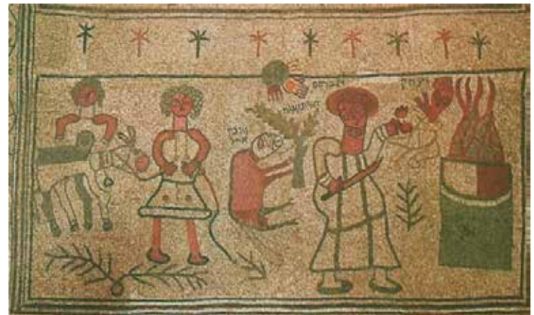
Spätjüdische Darstellung der Opferung Isaaks (ca. 5. Jhd)

Mit diesem Ehrentitel „al-Khalil al-Rahman“ („Freund des Erbarmers“) ist Abraham auch in die Geschichte und die theologische Tradition des Islam eingegangen. Aus diesem Ehrentitel leiten sich auch die arabischen Namen von Hebron und dem Jaffator in Jerusalem ab („al-Khalil“ und „bab al khalil).