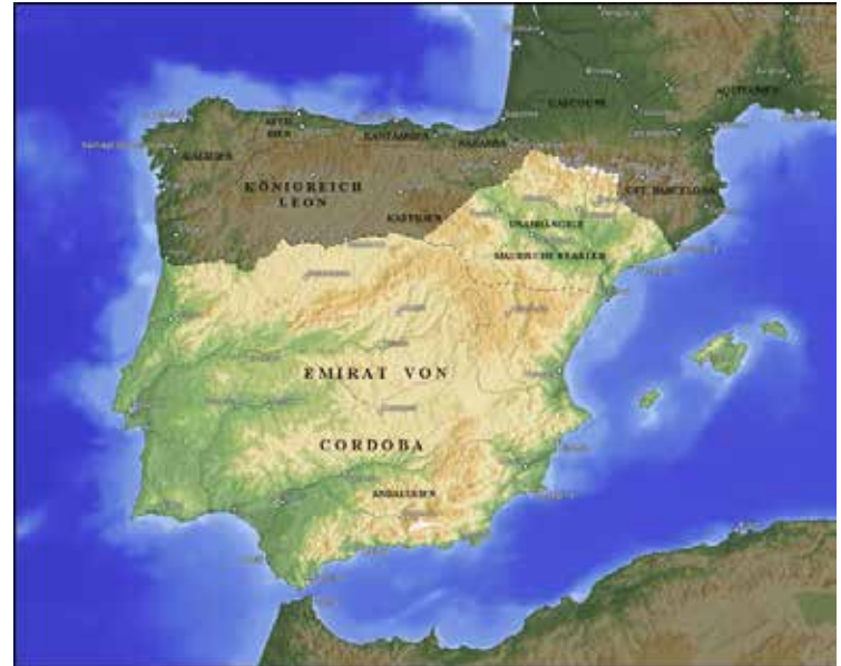
Das Emirats und spätere Kalifat Cordoba nahm über lange Zeit den größten Teil Spaniens ein.

711 [1] setzte Tariq ibn Ziyad [2] mit 7.000 Kriegern aus dem Magreb nach Gibraltar [3] über und brachte damit den Islam nach Spanien. Innerhalb einer relativ kurzen Zeit eroberte er, zusammen mit seinem Herrn Musa ibn Nusayr, Statthalter in Ifriqiya, der mit weiteren 18.000 Kriegern nachrückte, nahezu ganz Spanien. Doch im Jahre 714 wurde Tariq ibn Ziyad zusammen mit seinem Vorgesetzten Musa ibn Nusayr vom Kalifen al-Walid I. nach Damaskus beordert. Der Kalif war darüber erzürnt, dass die beiden ihn lediglich über die Eroberung informiert, aber nicht auf seinen Befehl gehandelt hatten. Tariq und Musa wurden ihrer Ämter enthoben und fielen in Ungnade. Nach der Einnahme der gesamten Iberischen Halbinsel überquerten die muslimischen Truppen schließlich auch die Pyrenäen und besetzten Teile von Südfrankreich. 732 wurden sie aber von den Franken unter Karl Martell in der Schlacht von Tours [4] besiegt und wieder in den Süden zurückgedrängt. 718 begann in der entlegenen Berggegend Asturiens [5] die Rebellion des vornehmen Westgoten Pelayo [6] , die zur Gründung des zu-