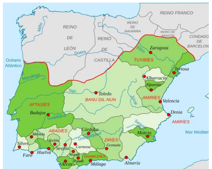
Die Zersplitterung durch lokale Taifas

in Spanien. Ali ibn Hammud an-Nasir wurde bereits nach zwei Jahren Herrschaft ermordet. Nachfolger wurde sein Bruder al-Qasim al-Ma'mun, der bisher Statthalter in Sevilla gewesen war. Abd ar-Rahman IV. wurde bei einem Angriff auf Granada von seinen Berbertruppen im Stich gelassen, besiegt und bei Guadix auf der Flucht ermordet.