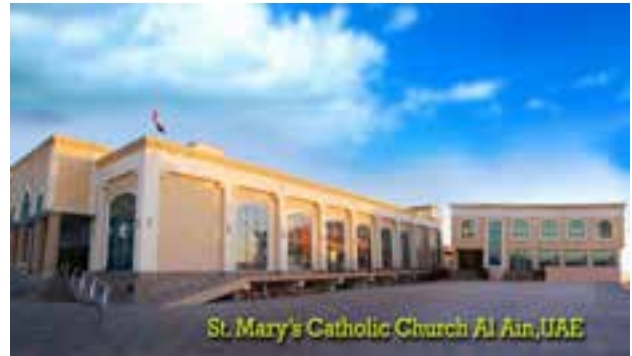
Marienkirche, Al Ain

Die Kirche liegt in der Oase Al Ain an der Grenze zwischen Abu Dhabi und Oman. Die erste Kirche wurde 1969 errichtet. 1981 bereits musste auch sie einer größeren Variante weichen.