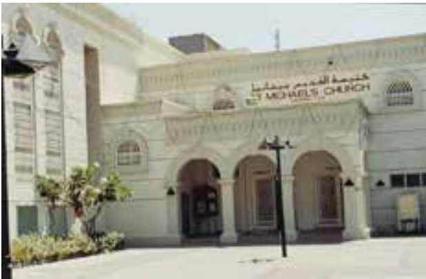
Kirche des Hl. Erzengel Michael, Sharjah

Die erste Michaelskirche wurde 1971 errichtet. 1997 wurde auch sie durch eine größere Kirche ersetzt.