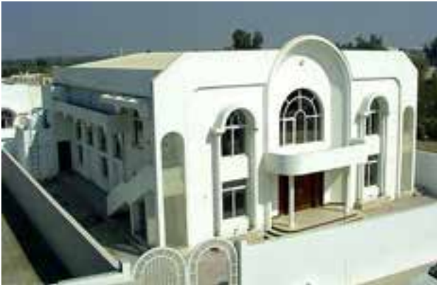
Kirche des Hl. Antonius von Padua, Ras Al Khaimah

Die erste Michaelskirche wurde 1971 errichtet. 1997 wurde auch sie durch eine größere Kirche ersetzt.