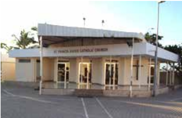
Kirche des Hl. Franz Xavier, Salalah

Diese Kirche wurde 1984 errichtet. Ihr angeschlossen ist ein Katechismus-Zentrum welches der kirchlichen Bildungsarbeit dient und dessen jüngsten Gebäulichkeiten 2012 fertig gestellt wurden.