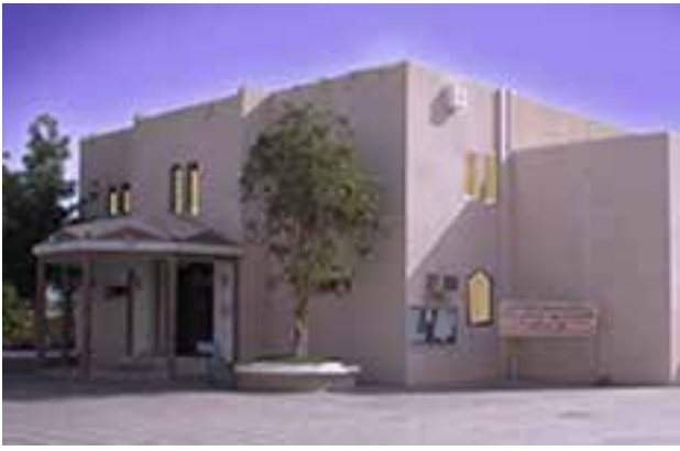
Kirche des Hl. Geistes, Ghala, Muscat

Schon ein Jahrzehnt nach der Errichtung der ersten Kirche der Hl. Peter und Paul wurde es nötig eine weitere, zweite Kirche in Muscat zu bauen. Damit wurde 1986 begonnen. Der Grundstein der Kirche wurde ein Jahr später im März gelegt und bereits im November des Jahres konnte die Einweihung der Kirche erfolgen. 1990 stiftete der Sultan die einzige Pfeifenorgel im Apostolischen Vikariat.