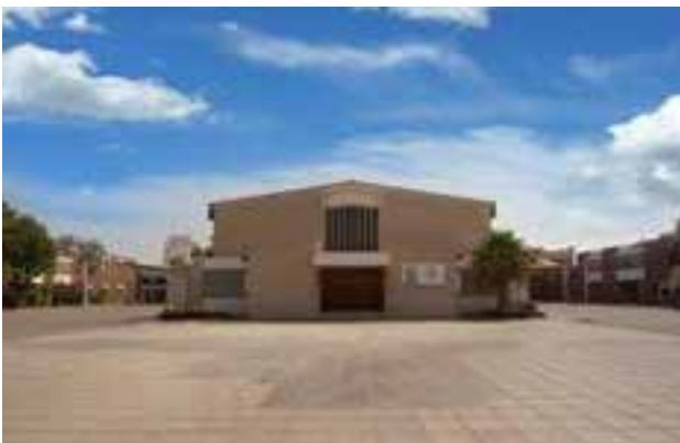
Kirche des Hl. Josef, Abu Dhabi

Hier lebt eine der größten Kirchengemeinden am Persischen Golf mit rund 100.000 Katholiken. Gottesdienste finden in mehreren