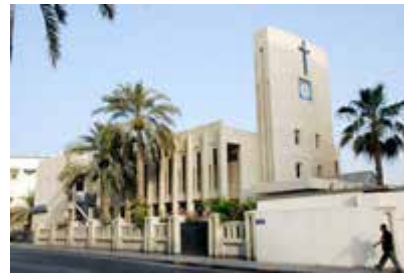
In Qatar die Kirche Unsere Frau vom Rosenkranz

In Bahrain existiert die Kirche des Heiligsten Herzens und in Awali die Marienkirche