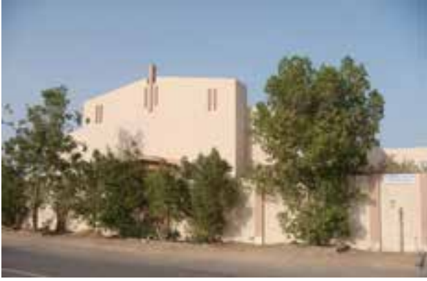
Kirche von der Mutter der Immerwährenden Hilfe, Fujairah

Diese Kirche wurde zusammen mit der St. Mary's Catholic High School 2002 errichtet.