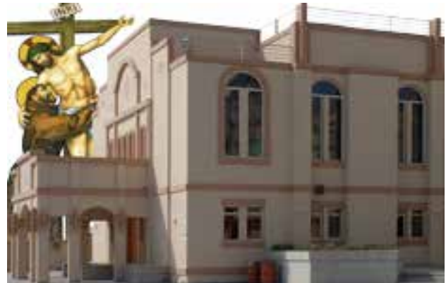
Kirche des Hl. Franz von Assisi, Jebel Ali

Grundsteinlegung: 2000 - Einweihung 2001