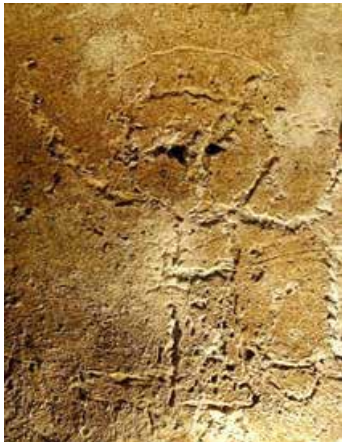
Graffiti in der Höhle

Johannes der Täufer und sein Wirken werden traditionell am Jordan lokalisiert. Als Geburtsort des Täufers gilt Ein-Karem, im Tal unterhalb von Yad Vashem gelegen – zu Zeiten Jesu einmal ca. 4 Kilometer von der Stadt Jerusalem entfernt.