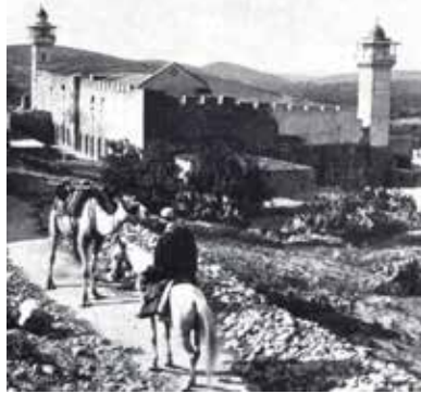
Machpela Hebron 1929

ließen sich größere Gruppen von Juden wieder in Hebron nieder. Im Jahr 1929, wurde die Stadt vorübergehend von allen Juden verlassen – als Ergebnis eines mörderischen Pogrom von Arabern, dem 67 Juden zum Opfer fielen – der Rest wurde gezwungen zu fliehen.