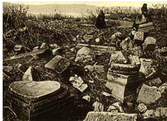
Kafarnaum vor 1894

lium des Matthäus berichtet in 4,13 über Jesus: „Er verließ Nazareth, um in Kafarnaum zu wohnen, das am See liegt, im Gebiet von Sebulon und Naftali.“