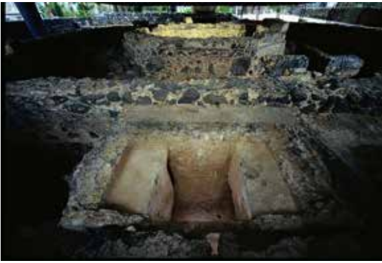
Oktagon und Taufbecken

Oktagon von 16,33 Metern. An fünf der acht Seiten war wohl je ein Portikus (Säulengang / Säulenhalle) vorgelagert, die je von 8 Säulen gebildet wurden. Die drei Portikus-freien Seiten hatten an zwei Stellen Anbauten, die mit einem Gang verbunden waren und heute oftmals als „Sakristeien“ gedeutet werden. Zu einem späteren Zeitpunkt wurde dort eine Apsis errichtet mit einem in den Boden eingelassenen Taufbecken. Da nicht bekannt ist, dass Kafarnaum jemals Bischofssitz war, wird das Taufbecken in die Tradition der sogenannten „Pilgerreisen zu Heiligen Orten“ eingeordnet, wie das auch für den Berg Nebo und andere bedeutsame Orte galt. Es wird also davon ausgegangen, dass der Taufort in der Basilika überwiegend der Taufe von Pilgern gedient haben dürfte.