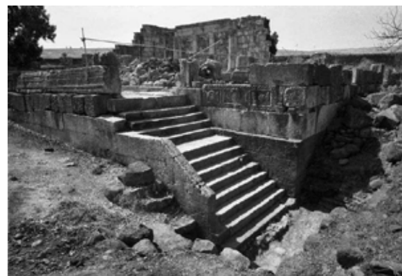
Status um 1930

Man darf wohl davon ausgehen, dass diese Bemerkung kein Hinweis auf eine nebensächliche Dimension im Leben Jesu ist. Zwar spielt der Hinweis auf Sebulon und Naftali auch im Kontext der „Erfüllungs-Theologie“ der jungen Christenheit eine Rolle und soll deutlich machen, dass Jesus der Is 8,23 1 und 9,1 angekündigte Lichtbringer ist, aber es darf auch angenommen werden, dass, ab einem bestimmten Zeitpunkt, Jesus seinen Lebensmittelpunkt tatsächlich von Nazareth nach Kafarnaum verlegt hat. Die vielen Berichte über seine Aktivitäten um den See von Galiläa und auch die Häufigkeit von Beispielen aus der