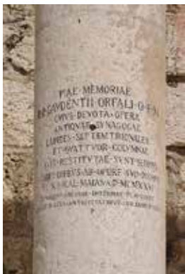
Inscription zum Gedenken an Giuseppe Orfali

Der Tiefenpsychologe und Theologe Eugen Drewermann macht in diesem Kontext aufmerksam darauf, dass die in den Synoptikern berichtete Fiebererkrankung der Schwiegermutter des Petrus 4 durchaus als psycho-somatische Reaktion auf die befürchtete Loslösung des Hauptnährers von der Familie empfunden werden kann. Natürlich ist eine solche Überlegung hypothetisch - aber sie ist menschlich und sie ist menschlich nachvollziehbar: da ist einer, der hat sich angefreundet mit dem Schwiegersohn Petrus und nun hat er von diesem so sehr „Besitz ergriffen“, dass der Familienvorstand bereit scheint, ein relativ sicheres Auskommen als Fischer am See einzutauschen gegen ein deutlich weniger gesichertes Leben als Jünger eines Wander-Rabbi - verbunden mit der Gefahr entweder bei den religiösen oder den politisch Mächtigen, oder gar bei beiden zugleich, auf Widerstand zu stoßen. Solche Ängste können krank machen.