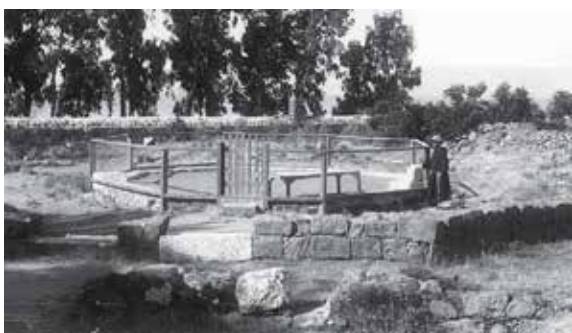
Oktagonale Kirche - Status 1921

lehrte Jesus 2 , es wird von Heilungen in Kafarnaum berichtet und er beruft seine ersten und bedeutsamsten Jünger in diesem Ort am See. Möglicherweise spiegelt die sogenannte „Verfluchung Kafarnaums“ („Und du, Kafarnaum, meinst du etwa, du wirst bis zum Himmel erhoben? Nein, in die Unterwelt wirst du hinabgeworfen.“ 3 ) eine Enttäuschung über die mit Kafarnaum verbundenen Erwartungen wieder, die sich nicht erfüllten. Aus den Berichten des Neuen Testaments lässt es sich nicht erschließen wie lange Jesus vor seinem Auftreten in der Öffentlichkeit in Kafarnaum gelebt hat; es dürfte aber eine gewisse Weile gewesen sein, schon allein mit Blick darauf, dass es auch der Zeit bedurfte, um Menschen so an sich zu binden, dass sie bereit waren in die Nachfolge einzusteigen und mit Jesus auf „Tour“ zu gehen. Zwar versucht das Neue Testament die Berufungen der Jünger nach dem Schema: „gerufen vom Fremden - umgehend folgend“ zu beschreiben, weil es dahinter göttliches Wirken anzeigen möchte, doch darf mit Recht angenommen werden, dass es auch für Jesus galt, sich zunächst vertraut zu machen mit den Menschen, die ihm später - bis in den Tod - folgen sollten.