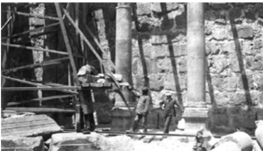
1905 H. Kohl und C. Watzinger arbeiten in der Synagoge

Zwar war, so zeigen es die Ergebnisse der verschiedenen Ausgrabungen, Kafarnaum bereits um 1300 vor der Zeitrechnung besiedelt, doch tatsächliche Bedeutsamkeit erreichte der Ort wohl erst im 2. Jahrhundert vor der Zeitrechnung. Eine „Blüte“ kann für Kafarnaum dann im Zeitraum des 4. und 5. Jahrhunderts unterstellt werden. Kafarnaum wurde 746 durch ein Erdbeben zer-